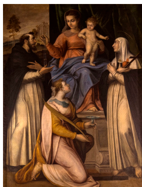
Le don du Rosaire, attribué à Coriolano Malagavazzo (1587) (église de Gassin).