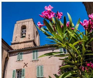
L'église Notre-Dame-de-l'Assomption (achevée en 1558).